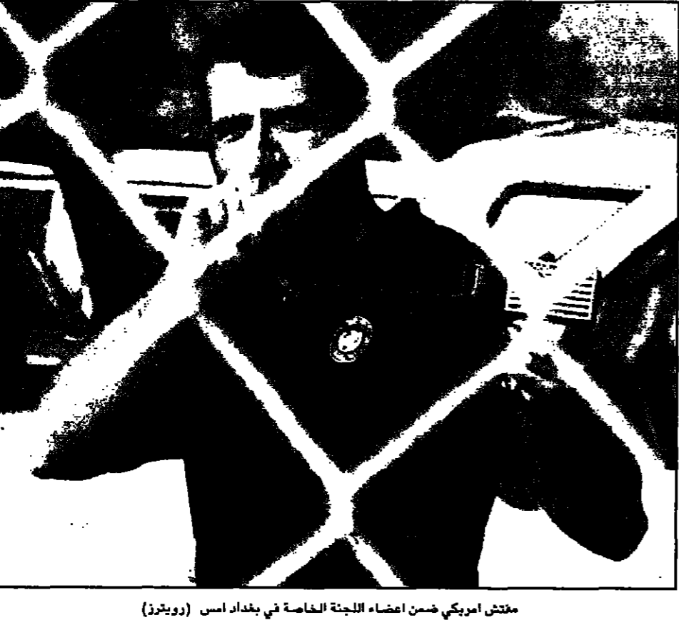
مجلس امريكي ضمن اعضاء اللجنة الخاصة في بغداد امس

واشنطن تحذر من «أزمة جديدة» إذا منعت بغداد المفتشين من الدخول الى مقر اقامة الرئيس العراقي. واشنطن تحذر من «أزمة جديدة» إذا منعت بغداد المفتشين من الدخول الى مقر اقامة الرئيس العراقي.